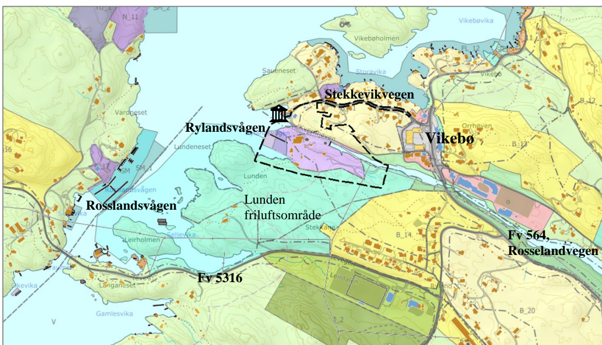
Oversiktskart som viser lokalisering av planområdet – vist med svart stipla linje.

Planområdet ligg på Vikebø i Alver kommune, og omfattar m.a. næringsareal knytt til eksisterande landbasert oppdrettsanlegg i Rylandsvågen, samt friluftsområde og deler av tilkomstveg Stekkevikvegen.